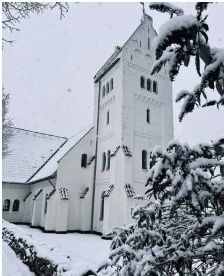
I sne står urt og busk og Nazarethkirken i skjul.