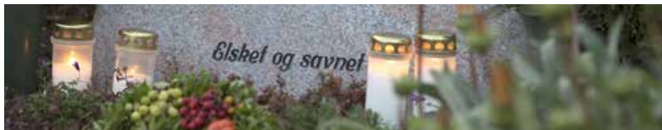
Ved Allehelgen mindes vi vores døde med tak.