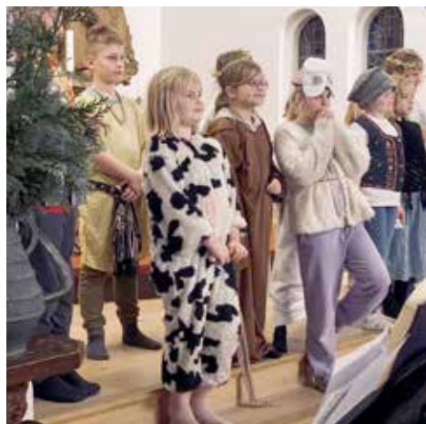
Forventningsfulde børn ved sidste års krybbespil.

Der kommer indbydelse ud med flere oplysninger via Forældreintra for børn på Ryslinge Friskole, når tiden nærmer sig. Går du ikke på Ryslinge Friskole,