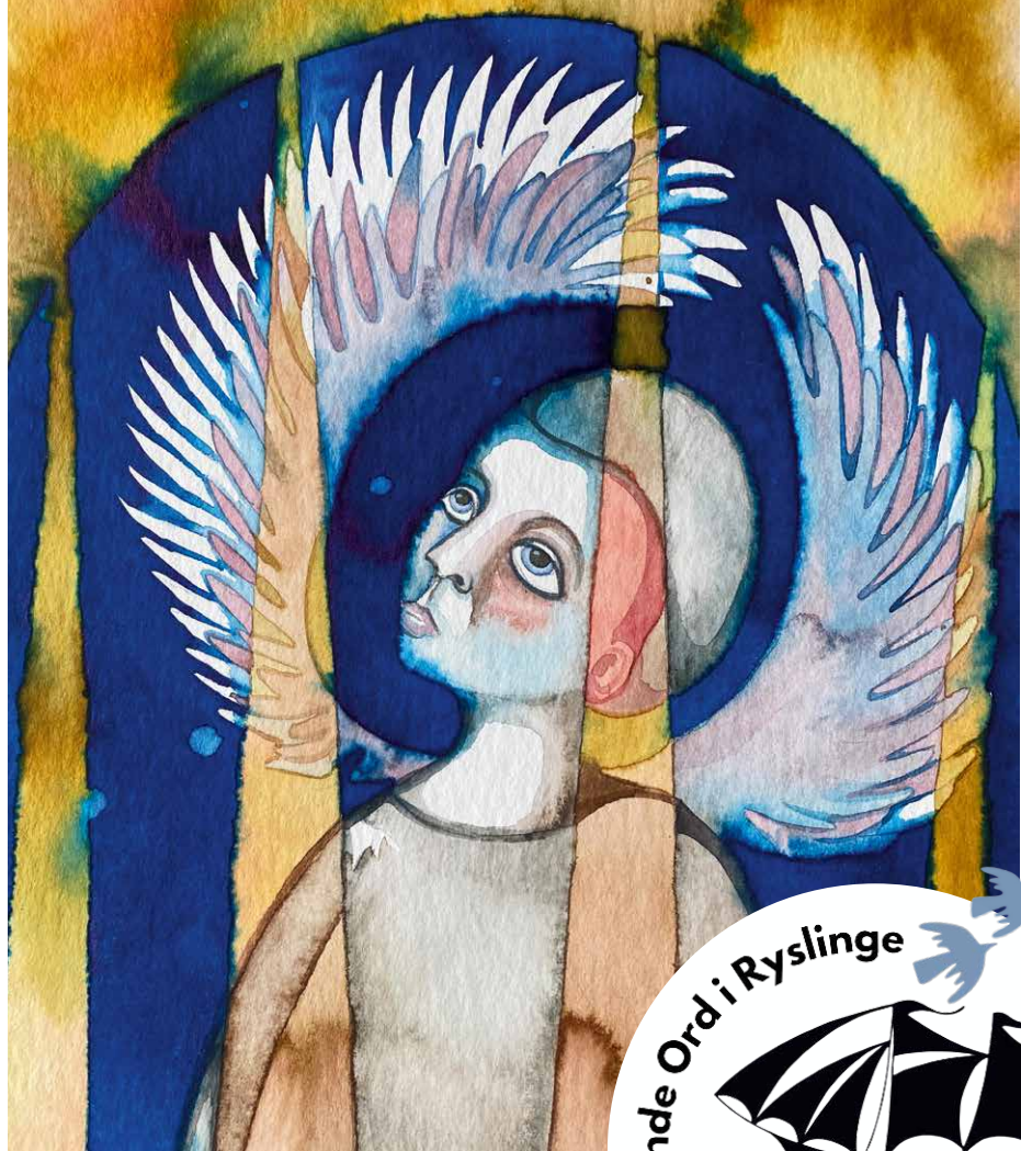
Illustration af Lise Kaltoft.