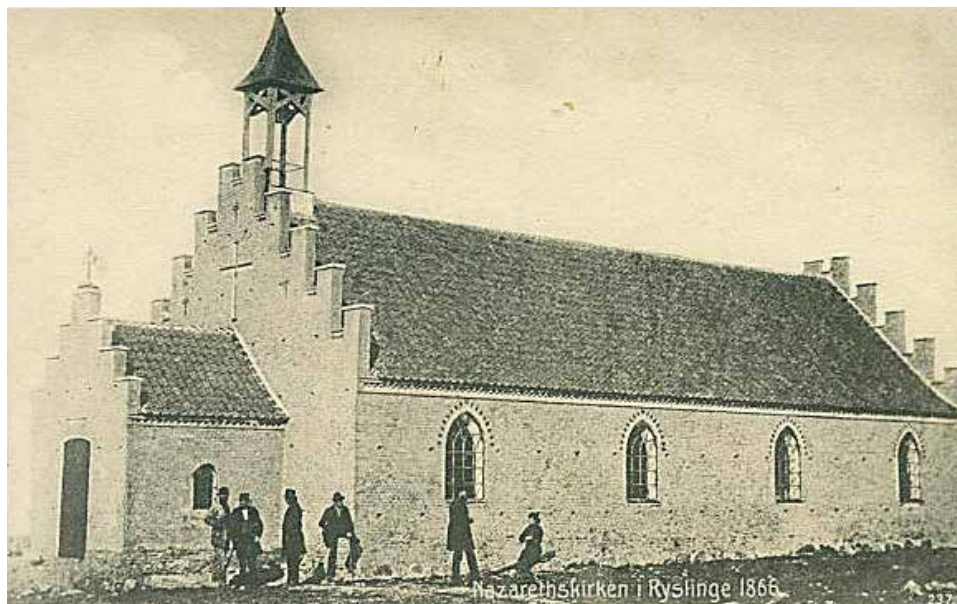
Nazarethkirken i 1866.