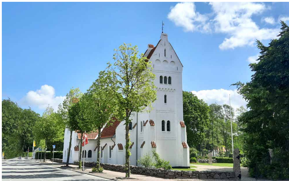
Nazarethkirken i dag.