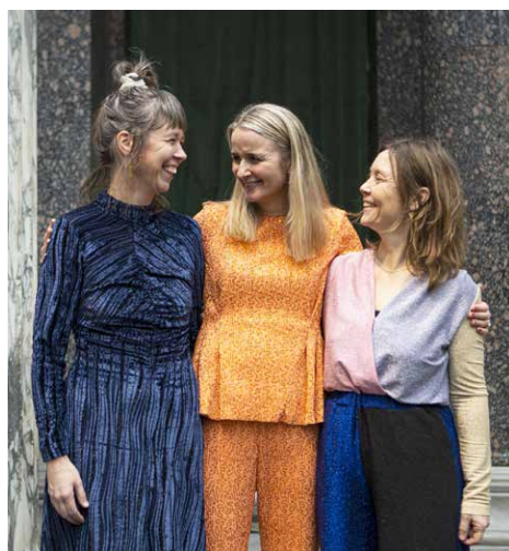
Vokaltrioen O P H A V.

Tid og sted: Nazarethkirken og Ryslinge Højskole søndag d. 15. september 2024 fra kl. 13.00.