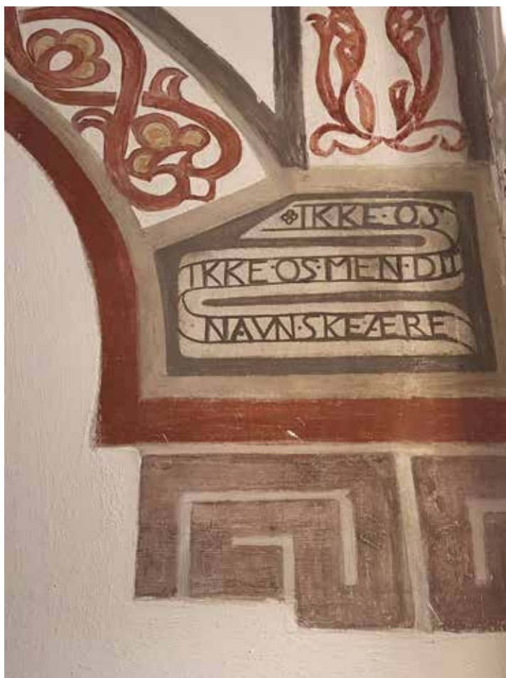
Detalje fra koret i Nazarethkirken.