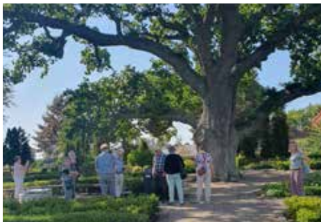
Landet kirkegård med den smukke eg og Elvira Madigan og Sixten Sparres gravsted.

Derefter var vi rundt og udforske museets mange udstillinger, hvor man blandt andet kan se folkemindesamlingen, som rummer alt fra legetøj til gamle brudekjoler og folkedragter. Også musikhuset og rebslagerhuset var et besøg værd, samt selvfølgelig museets udstilling og fortælling om Elvira Madigan og Sixten Sparre.