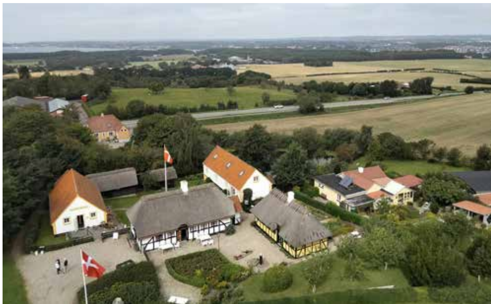
Tåsinge Museum set fra Bregninge kirkes tårn.