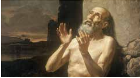
Job, den pinte, plagede og lidende mand, der dog nægter at opgive sin tro på Gud.

Vi er kommet et godt stykke ind i det Gamle Testamente og henover efteråret fortsætter vi vores vej gennem Bibelen. Inden jul får vi blandt andet læst store og vigtige skrifter som Jobs Bog, Salmernes Bog, Prædikerens