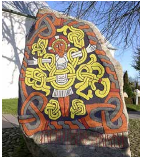
Jellingstenen, bemalet elektronisk.