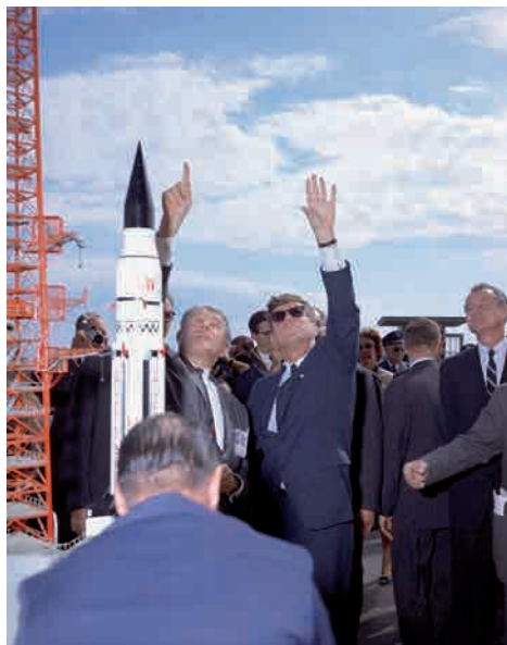
Præsident Kennedy besøger NASA

Hallo? Har han ikke øjne i hovedet? Kan han ikke se, at hun med sine halvopløste hænder for gang nummer tusind