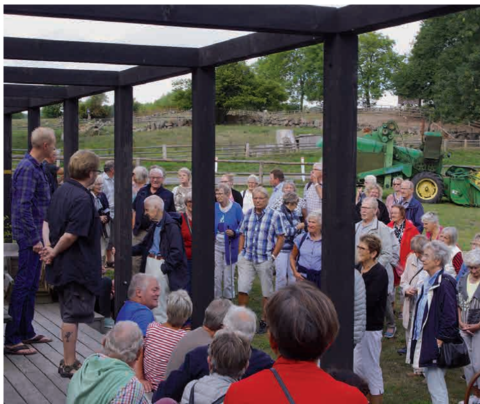
Fra højskoleugen på Bornholm. Vi hører om den lokale gastronomi ved madkulturhuset ved Melstedgård.

Tid: Søndag d. 6. januar kl. 13.00-17.00 Sted: Nazarethkirken, derefter Ryslinge Højskole Entré.