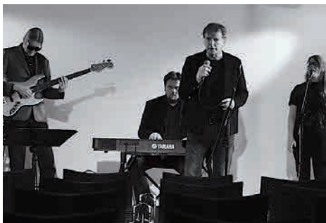
Leonard Cohen Tribute.