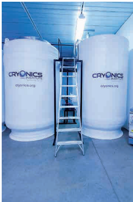
Cryonics' nedfrysningstanke i Michigan, USA.

Det er i dag påskedag, og påskedag handler om alt det modsatte. Påskedag handler om noget fuldstændigt ukontrollabelt, om en opstandelse, der sætter os ind i en historie med så vidtrækkende konsekvenser, at alt vores eget