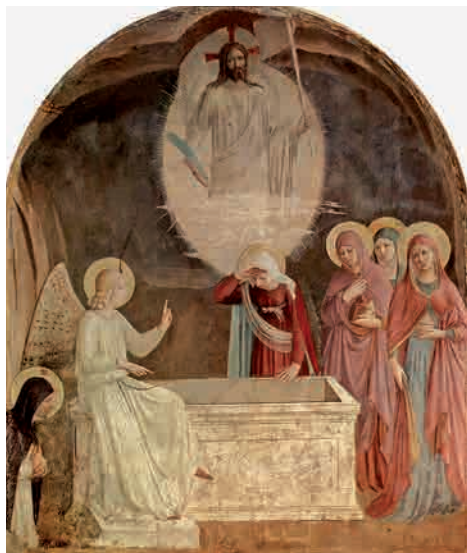
Kvinderne ved graven. Fra Angelico (1440-42).

Det er så glædeligt, som noget kan være. Det er så rystende, at alt hvad vi tidligere mente at vide om livet og døden, nu er vendt på hovedet. Det er så forunderligt, at selv lærkens sang, blæstens susen og bølgerens brusen fra nu af