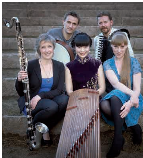
Phønix og Sangka.