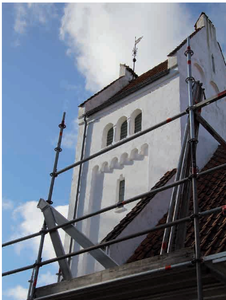
Nazarethkirken restaureres. Stilladset tårner sig op.