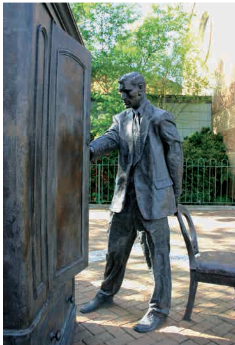
Statue af C.S. Lewis i Belfast.

Da gik det op for ham – skriver han i sin dagbog – at bønnen ikke forandrer Gud, men den forandrer mennesket.