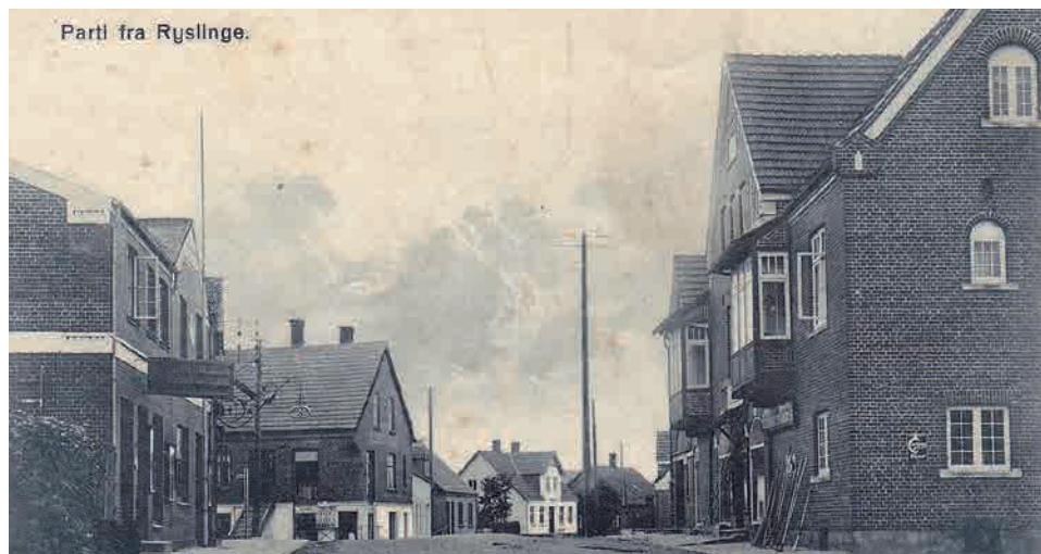
Parti fra Rødamsvej i det gamle Ryslinge.