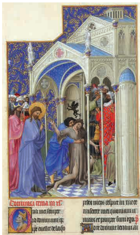
Jesus uddriver den urene ånd. Illustration fra fransk tidebønnebog, 15. årh.

Men så hører vi i dag om faderen til en syg dreng, der opsøger Jesus. Efter symptomerne at dømme kan man let få den tanke, at drengen lider af epilepsi. Det er sikkert rigtigt. Han får anfald, hvor han fræder, skærer tænder og er som en besat. Og hvis vi tager vores overfladiske og overlegne maske på, ja, så kan vi jo bare affærdige evangeliet ved at sige, at fortællingen har mistet sin relevans, for i dag kan den slags kureres med piller. Så hvad skal vi overhovedet bruge Jesus til?