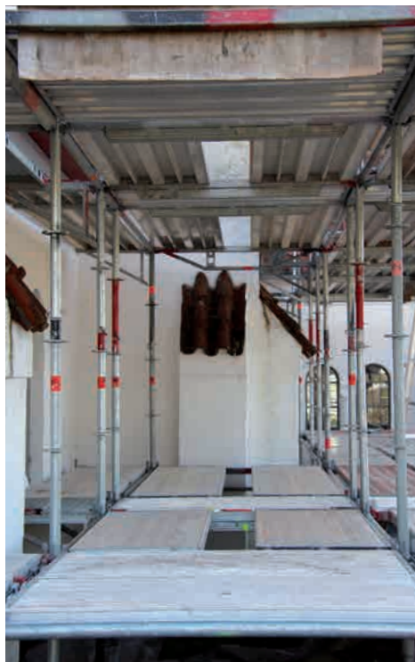
Kirken gemmer sig et sted bag stilladset.

de p-pladser. Her må vi gøre brug de p-pladser, der er omkring os.