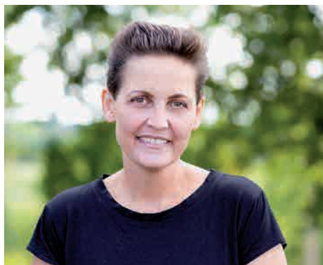
Pia Olsen Dyhr.

menigheden, sognekirken, friskolen, lokalrådet samt naturligvis høj- og efterskolen. Dagen kommer til at byde på et væld af aktiviteter. Grundlovstalen bliver i år ved Pia Olsen Dyhr, MF og formand for SF. Se nærmere i dagspressen, hjemmesiden og på Facebook.