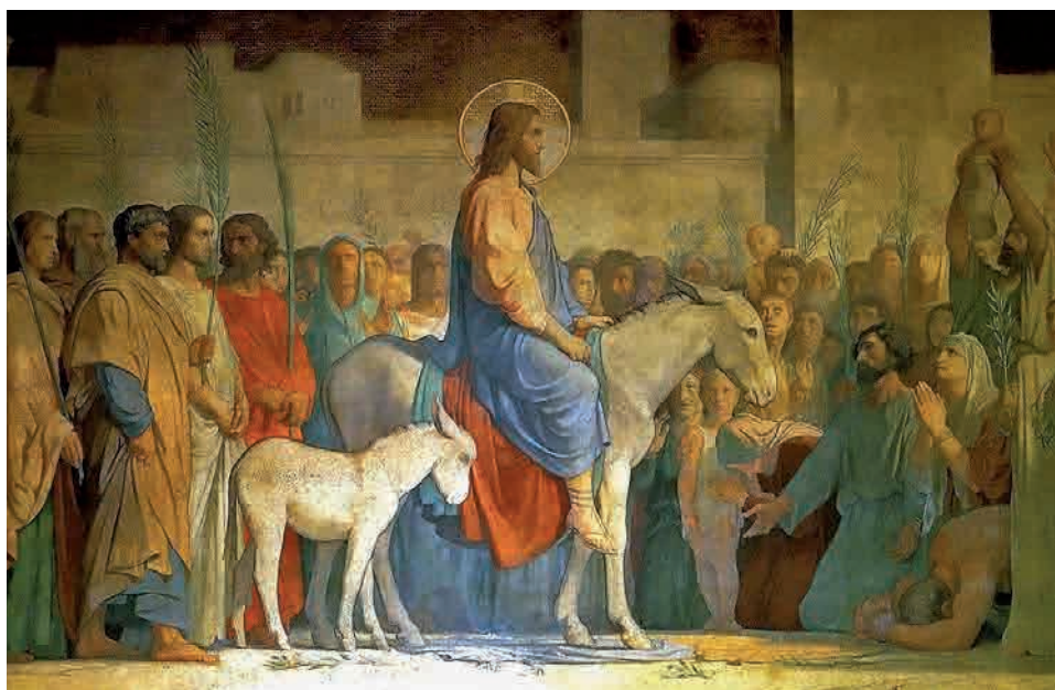
Indtoget i Jerusalem.

Og dog er der en helt afgørende forskel på de to nytårsdage. For når vi i dag tager hul på endnu et kirkeår, bliver vi mindet om, at vi midt i usikkerheden aldrig er alene. Søndag efter søndag vil vi nemlig også i det nye år blive mødt af budskabet om den Gud, der kommer til sine egne. Den Gud, som ikke længere blot er en abstrakt idé, en fåget forestilling, et åndeligt princip. Men den Gud, der blev kød og blod, blev menneske