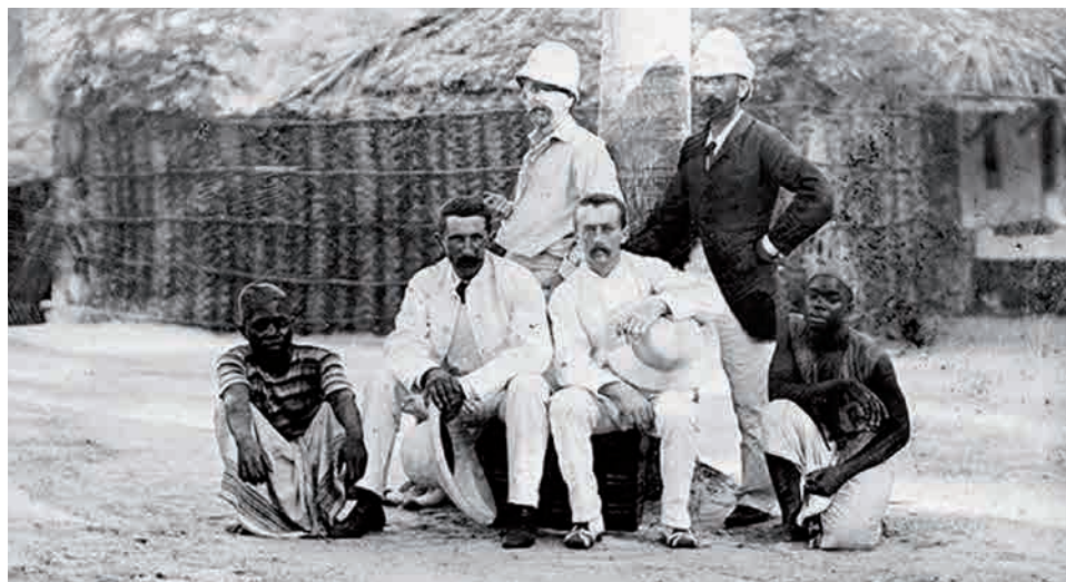
Engelske missionærer i Afrika o. 1900.

Men især det faktum, at manden var missionær, har været med til at kalde harmen og skadefryden frem. Og det minder os om, at begrebet mission – og især kristen mission – står i ret lav kurs i vores tid. Mission er i de flestes optik en tvivlsom affære. Vi hører ofte om, hvor meget skidt missionærer i Sydamerika og Afrika har påført den oprindelige befolkning. Vi har i vores tid en dybfølt respekt for det oprinde-