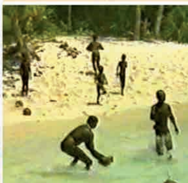
Beboere på North Sentinel Island.

ligesom os og som gjorde sit indtog iblandt os, i en krybbe i en stald, blandt Galilæas syge og forstødte, blandt Jerusalems palmesvingende tilhængere og hadefulde domsmænd. Som gjorde sit indtog i gravens mørke, så også vore døde kan hvile i Guds fred. Den korsfæstede og opstandne Kristus, som også i det nye år vil gøre sit indtog i vores liv. Som vil hjemsege os, forstyrre os, glæde os, forundre os og i det hele taget hive os ud af vores magelige komfortzone. Han som også i det kommende år vil være såvel et kors for tanken, en stjerne på himlen og en sten i skoen. Og med ham ved vores side bliver vi aldrig alene, heller ikke i det nye år.