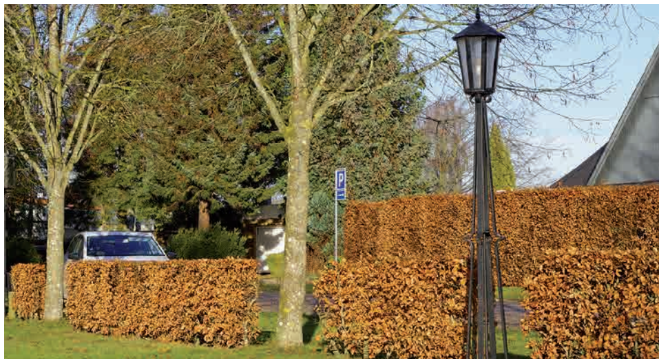
En – foreløbigt – tør P-plads.