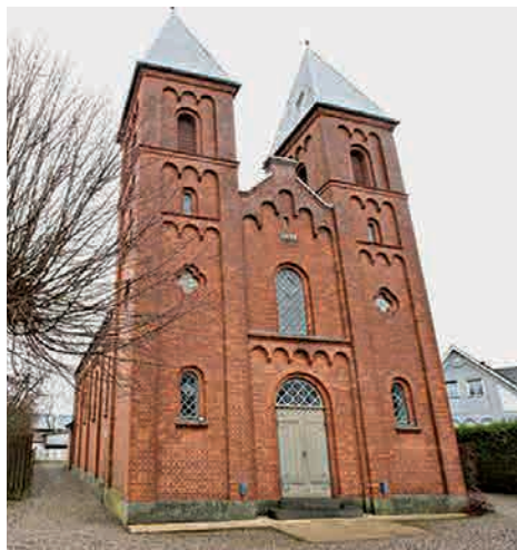
Betlehemskirken i Dalby.