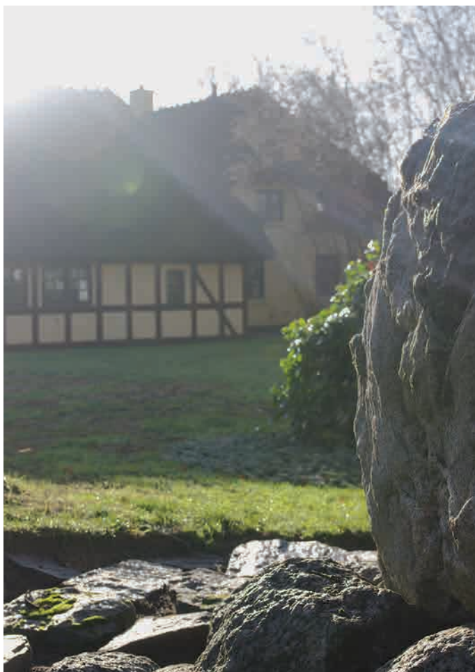
Kirkely i modlys.