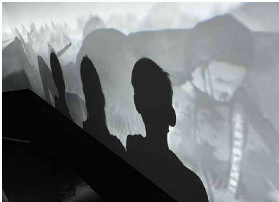
Konfirmandskygger på Moesgaard.

været lidt af et frirum for jer, et fast holdepunkt, et åbent rum i en tid, der jo ellers har været præget af nedlukning, hjemmeskole og social distance. Især i de måneder i vinteren og foråret, hvor I ikke kunne komme i skole, var det helt hyggeligt, at vi havde vores faste møde mandag eftermiddag i Ryslinge. Så var der dog noget hér i verden, der stod fast i en skør, skør tid.