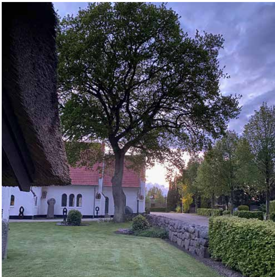
Sommernat ved kirken.