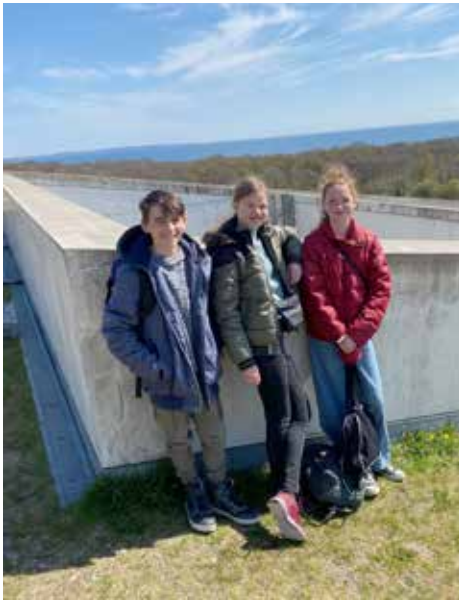
Med Århusbugten i baggrunden.

enden af tunnelen, og at vi snart kan se alle dem, vi ikke har kunnet mødes med i lang tid.