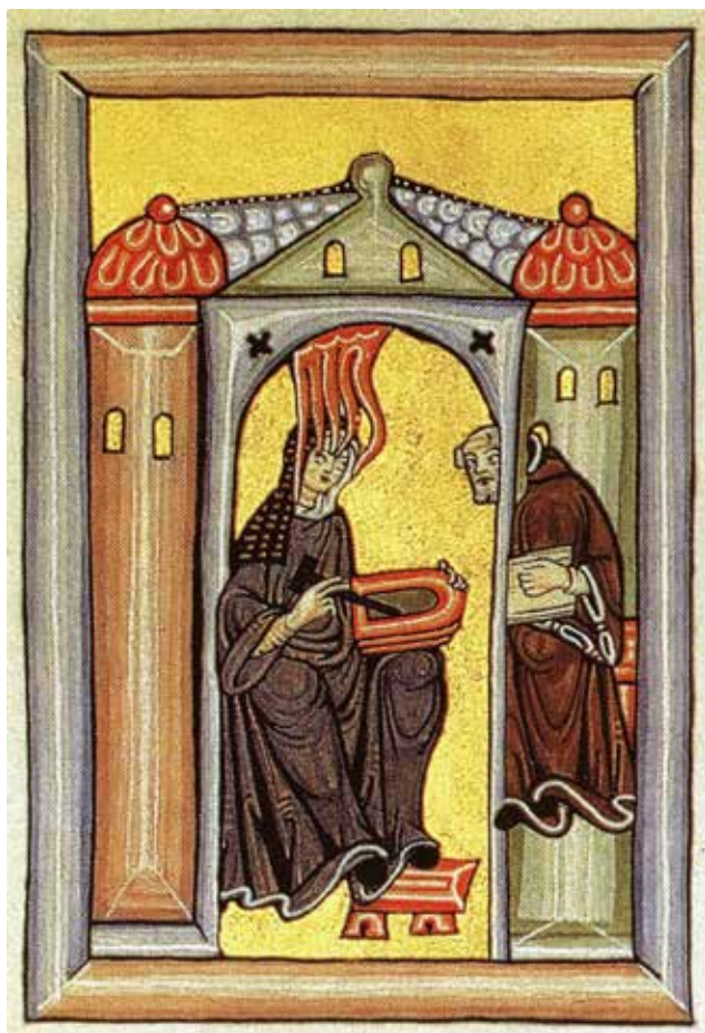
Hildegard af Bingen. Mid- delalderlig illumination fra bogen Liber Scivias.