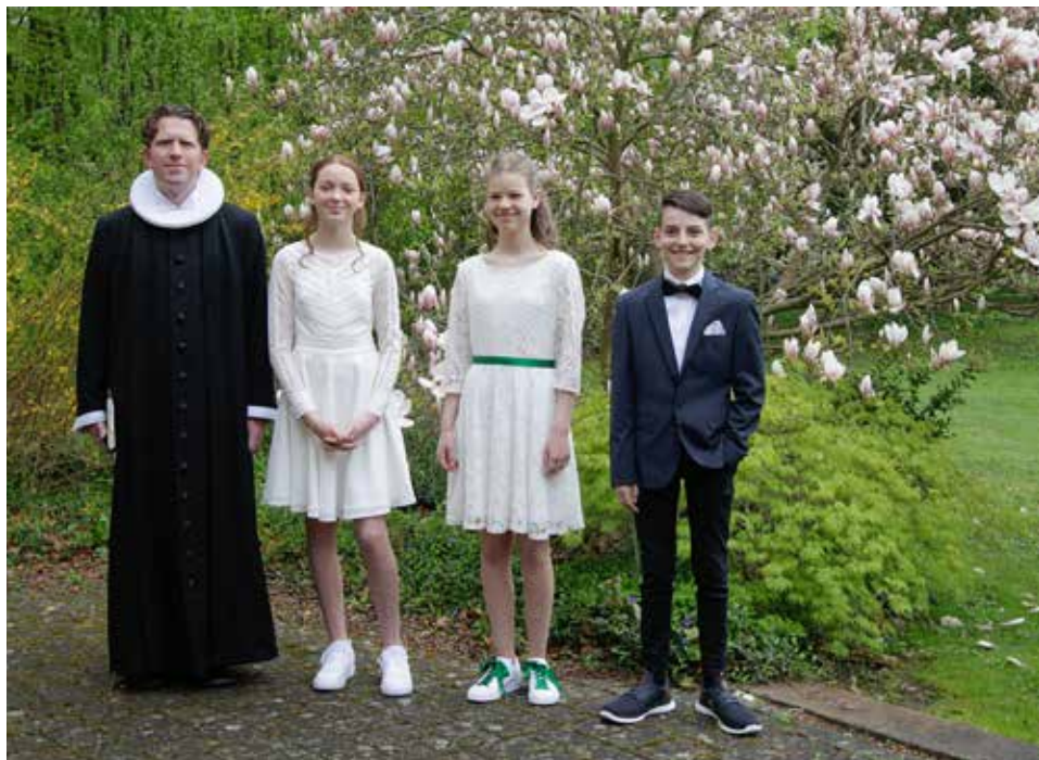
Konfirmanderne på den store dag.

Det skal ikke være nogen hemmelighed, at jeg vil komme til at huske jeres konfirmandhold som noget helt specielt. Det er der flere grunde til. For det første fordi I er så få. Vi har virkelig lært hinanden godt at kende, og hvor har det været hyggeligt. Der har været så meget god snak omkring bordet i præstegården, både om kristendom, liv og død og tilværelsens andre store spørgsmål; men også almindelig hyggensnak om livet som 7. klasser og alt hvad der hører med. Jeg bilder mig egentlig ind, at det at gå til præst netop i år har